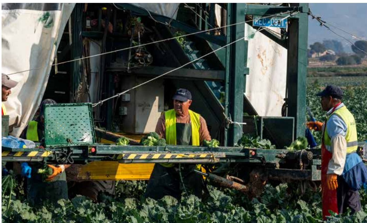
Recolección de brócoli en una finca de Murcia.