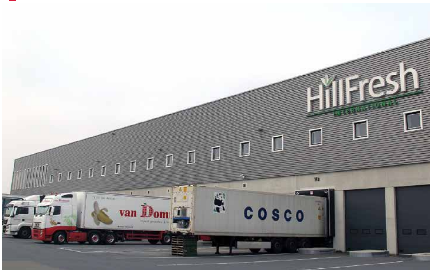
Muelle de carga y descarga de la empresa Hillfresh.